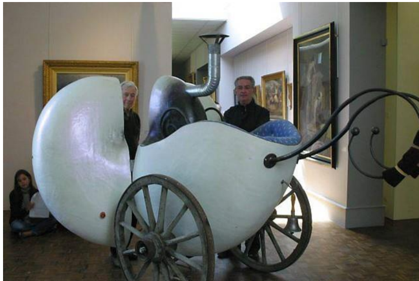
Ci-dessus, image d'une des œuvres de l'exposition Coquillages et crustacés , à Paris, en 2008, au musée des arts modestes.